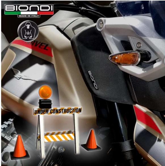
Cod. 8010522 Deflettori aria colore Fumè Scuro (semi - trasparente). Air Deflectors – Smoke Grey dark

Il prodotto è stato lungamente testato su strada con la nostra V85TT Travel nelle più svariate condizioni.